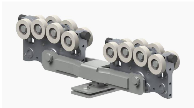
Závěsný vozík mostu dvojitý.