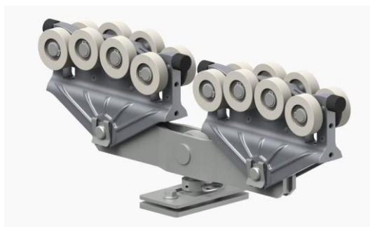
Závěsný vozík kladkostroje dvojitý.