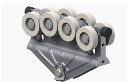
Závěsný vozík kladkostroje jednoduchý.